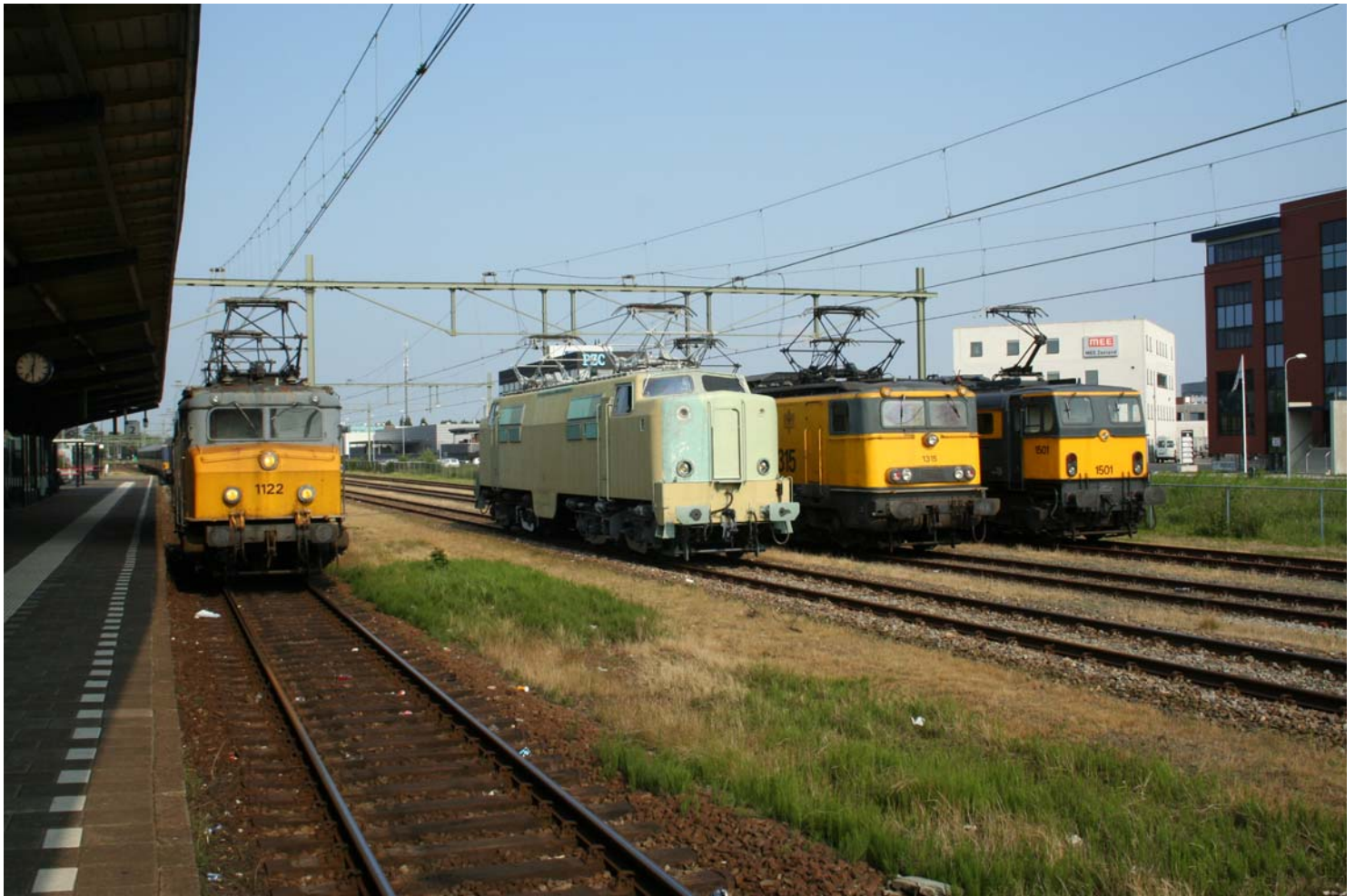
Onze "kroonjuwelen" bijeen te Goes op 2 juni 2007. V.l.n.r. 1122, 1201, 1315 en 1501.